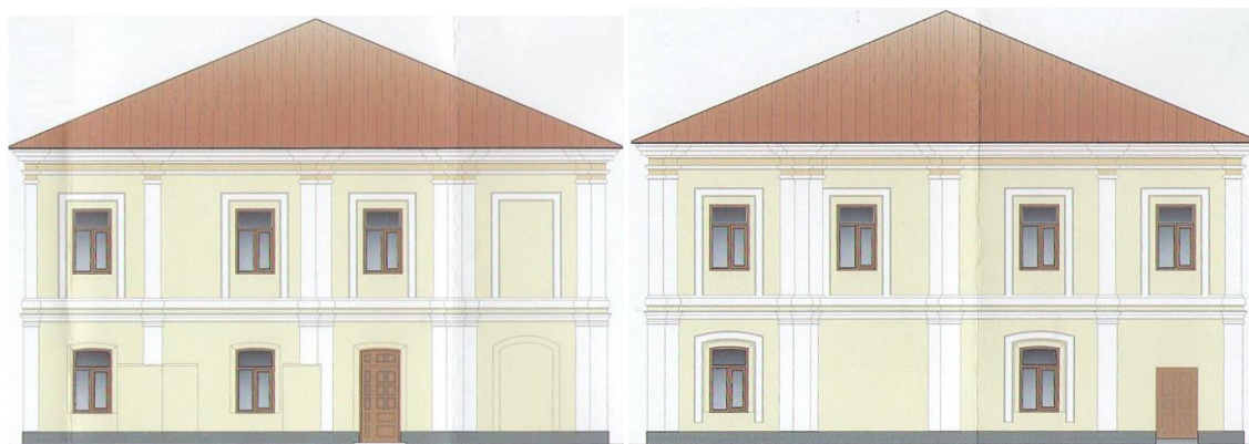
Західний фасад. Східний фасад.