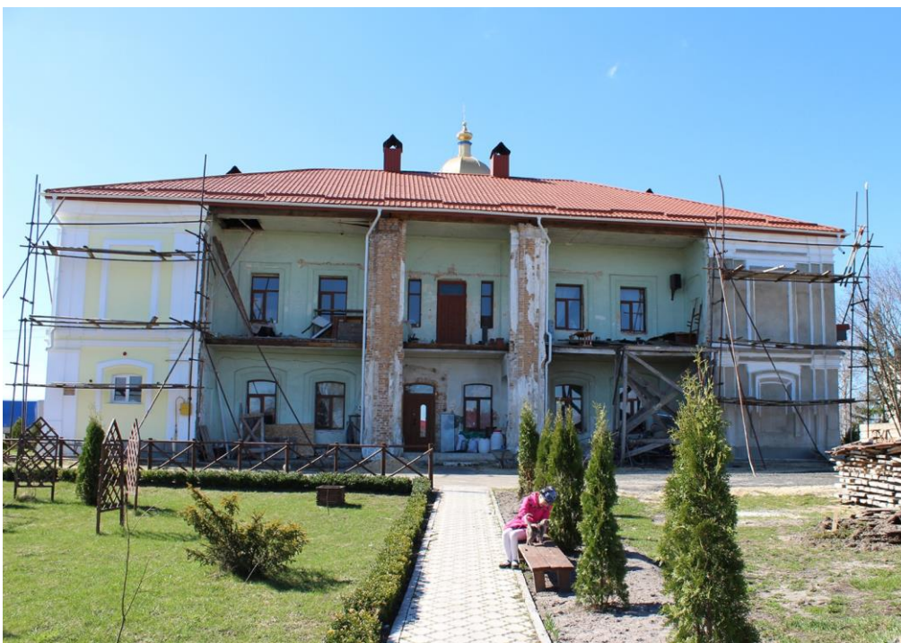
Сучасний стан монастиря.

Висновок. Під час написання статті автор виявив, що фасад Будинку митрополита Жидичинського чоловічого монастиря святителя Миколая