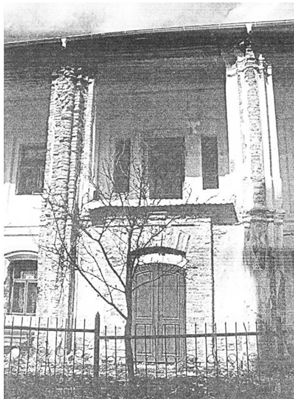
Рис. 2. Будинок Митрополита в с. Жидичин, Волинська обл. Фото 2008 р.