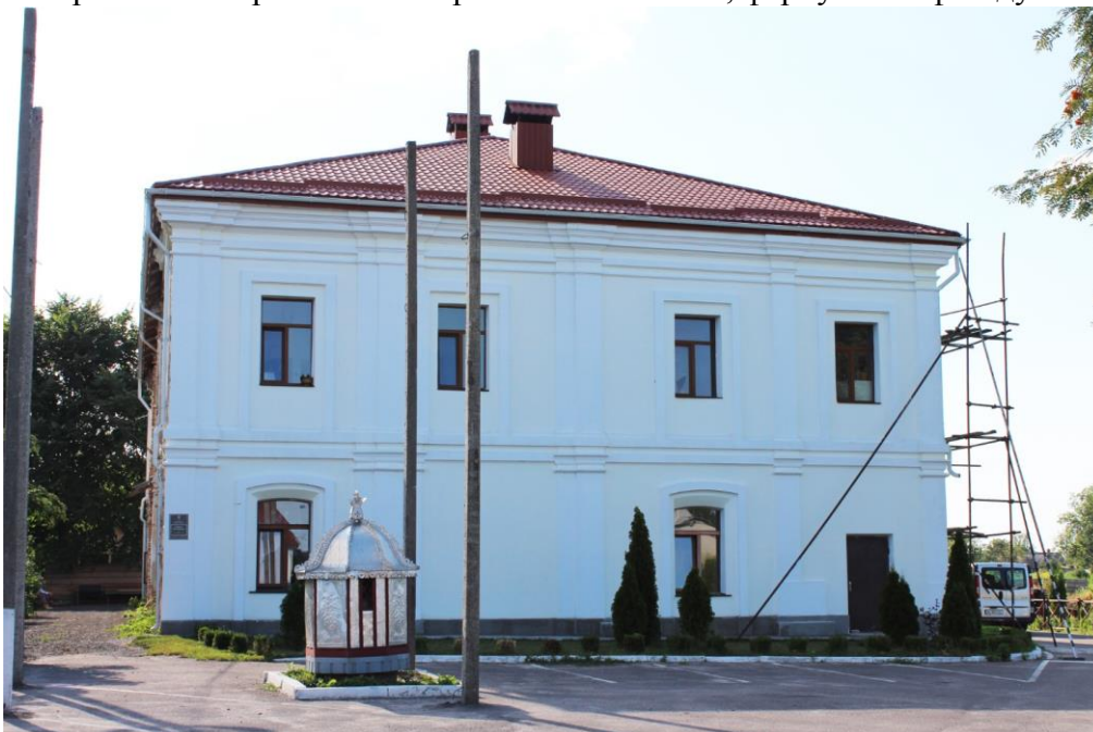
Сучасний стан монастиря.

рівна та гладенька, витягування карнизів, тяг, лиштв, наличників, обробка кутів, тяг, тинькування стовпів та напівкруглих елементів, фарбування фасаду.