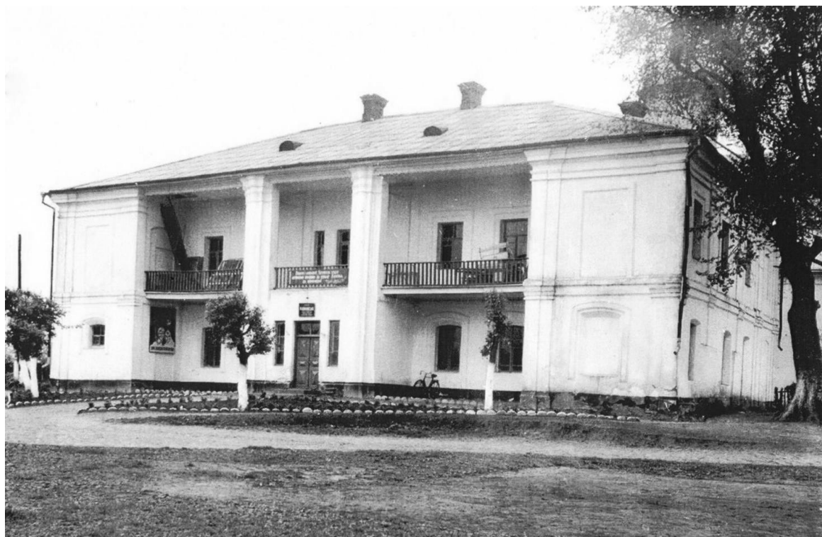
Рис.1. 1972 р.

пам'яток архітектури державного значення і через аварійний стан їх розібрали у 1990-х роках.