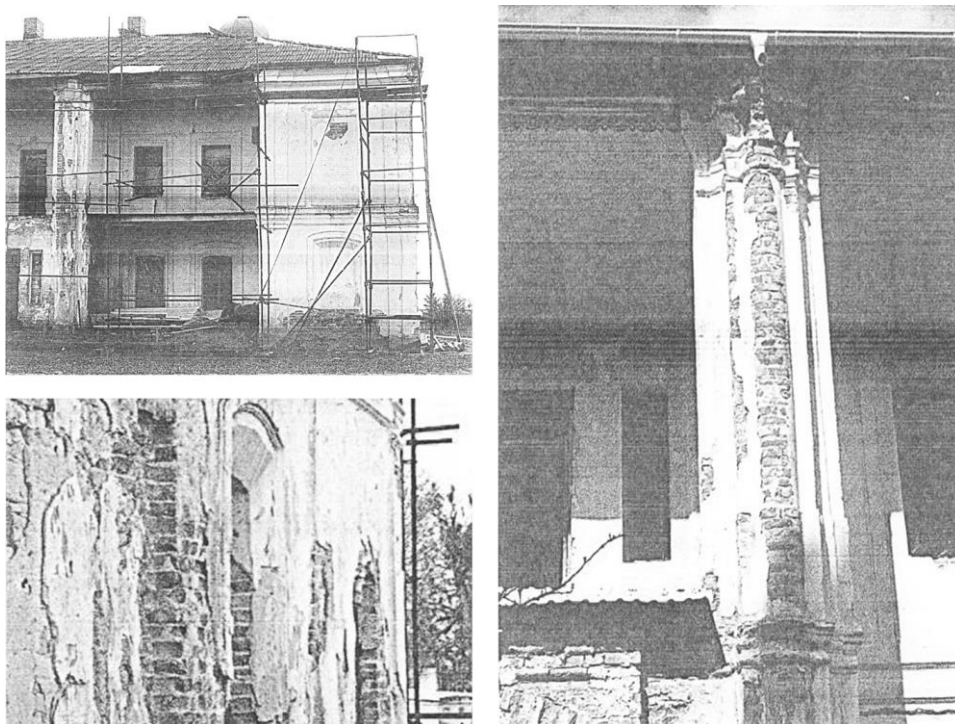
Рис. 4. Будинок Митрополита в с. Жидичин, Волинська обл. Фото 2008 р.

Етапи реставрації екстер'єру та інтер'єру монастирських приміщень тривають з 2008 року. Цей процес, на жаль, виявився затяжним, у першу чергу через брак коштів – усе фінансування залежить тільки від пожертв прихожан монастиря, його благодійників та жертводавців. Тому ремонтно-реставраційні роботи проводяться поступово, з урахуванням найважливіших проблем.