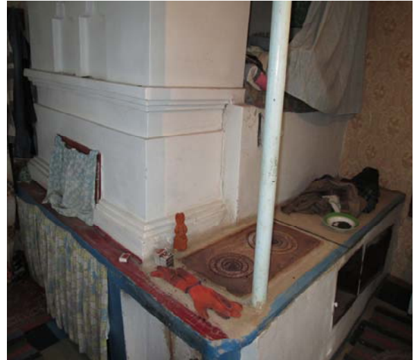
Рис. 7. Вариста піч з грубою та плитою (правобережний тип). Фото зроблене с. Гречене, Петриківського р-ну, Дніпропетровської обл.

У художньо-інформаційному довіднику «Символи Українства» піч віднесена до одних з найважливіших символів для українського народу, котрий пов'язаний з «материнським началом, непорушності сім'ї та неперервності традицій, її поважають, доглядають, прикрашають, її славлять і до неї горнутья. Бо вона дає тепло, що є диханням Божим, бо вона дає хліб, що є тілом Христовим. І це очищає нас від гріха і скверни. Вона дає їжу щоденну, благословенну Богом для міцності нашого тіла проти всіляких спокус. Піч – це родинний вітвар, де перебувають боги домашнього вогнища. Так вважали здавна. Напевно, тому, коли палиться в печі й родина перебуває перед її вогнем, між усіма панують мир, спокій і злагода» [2, с. 367].