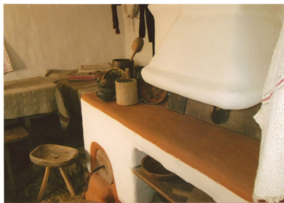
Рис. 2. Приклад української печі з комином (правобережний тип)

Лемківська піч, крім орієнтації її отвору на причілкову стіну мала комин, подібно до правобережного типу – він нависав над припічком, але мав форму Г-подібної труби, коротка частина якої нависала над припічком, а подовжена з'єднувалася за стіною сіней, у якій був отвір для виводу диму в сіни.