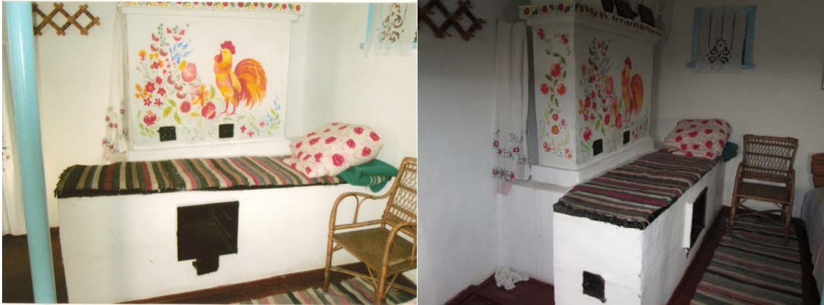
Рис.6 Грубка з лежанкою розписана рослинним малюнком. Світлина зроблена в с. Галушківка Петриківського р-ну Дніпропетровської обл.

розмальовують тепер не самий грунт стін у печі, але дають мальовання на окремих аркушиках паперу, що ними й обліплюють поверхню печі, а на самому грунті дають підведення, що часто зберігається. Цей спосіб орнаментувати, що з'явився пізніше за мальовання на грунті, не однією своєю стороною нагадує спосіб облицьовувати печі мальованими кахлями [4, с. 26].