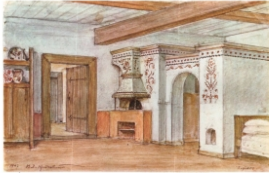
Рис.4. Зразок варистою печі з комином (лівоберезний тип). Ілюстрація з книги В. Щербаківського [29]

Від комина до сінної стінки, в якій була вироблена відповідна дірка, йшов горизонтально лежак, себто горизонтальна труба, яка в стінці закінчувалася каглою, себто круглою діркою, з якої дим виходив на сіни під бовдур і комин» [29].