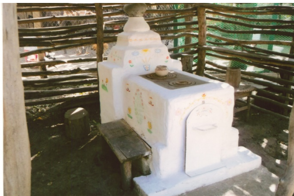
Рис. 1. Кабиця – піч для літнього приготування їжі. Фото зроблене в с. Рубанівське Синельниківського району території хати-музею Івана Манжури