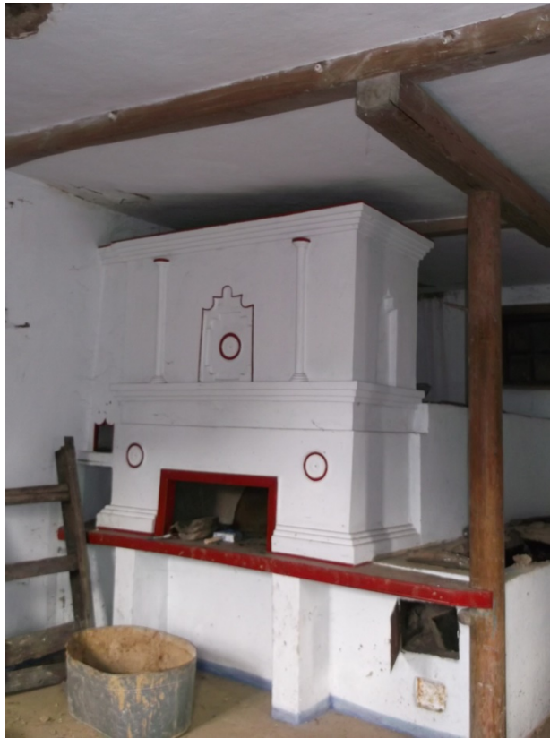
Рис. 3. Тип лівобережної печі. Світлина зроблена у с. Гречене Петриківського р-ну Дніпропетровської обл.

описана технологія облаштування димаря – вони плетуться з лози і з обох боків (внутрішньої та зовнішньої обмащуються глиною).