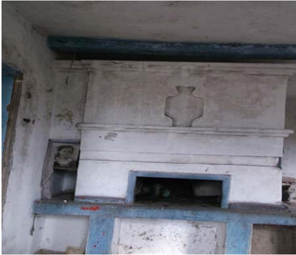
Рис. 6. Вариста піч (правобережний тип). Фото зроблене с. Гречене, Петриківського р-ну, Дніпропетровської обл.