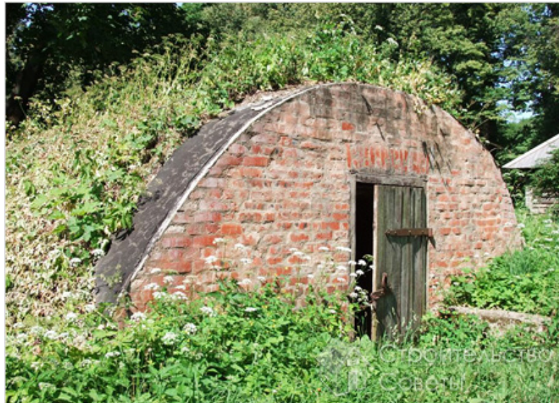
Рис.13. Сучасний льох (с. Гречине, Петриківський р-н, Дніпропетровська обл.)

Висновки. Сьогодні льох - це не тільки комфортне сховище для овочів, фруктів, вина, консервованих продуктів та іншої провізії, а і стильна прикраса присадибного ландшафту. Якщо у вас ще немає льоху, то обов'язково варто його побудувати. Він підвищує автономність та комфортність вашої садиби, оскільки, на відміну від холодильника, не залежить від електрики. Будівництво погреба вимагає менших витрат на будматеріали (приблизно на 25 %), якщо його будувати спільним для двох родин-сусідів на межі земельних ділянок з окремими