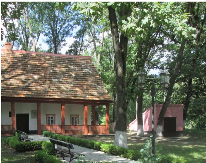
Рис. 2. Льох на території Музею-заповідника Тобілевичів (хутір Надія, Кіровоградська обл.)

Серед малих архітектурних форм погріб (льох) не належить до символічних об'єктів