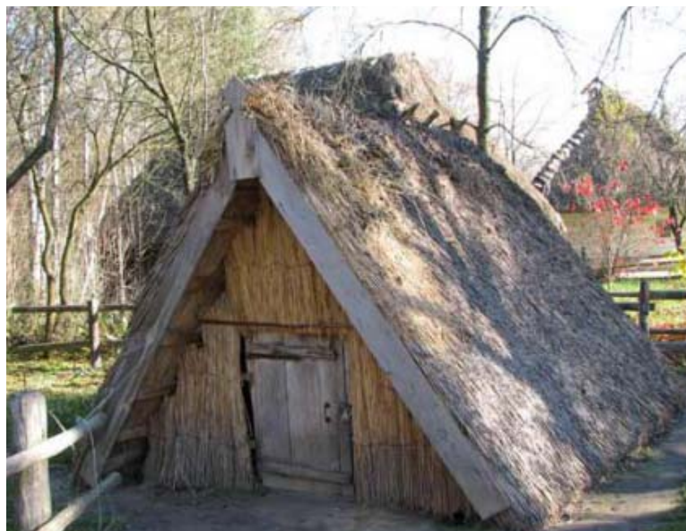
Рис. 6. Погрібник на території сільської садиби