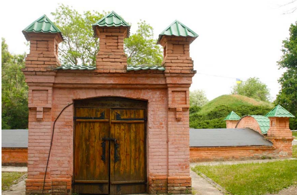
Рис. 3-а. Вхід до льоху Дендрологічного лісного центру «Веселі Боковеньки» (с. Веселі Боковеньки, Кіровоградська обл.)