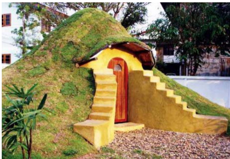
Рис. 10. Льох на території сучасної садиби