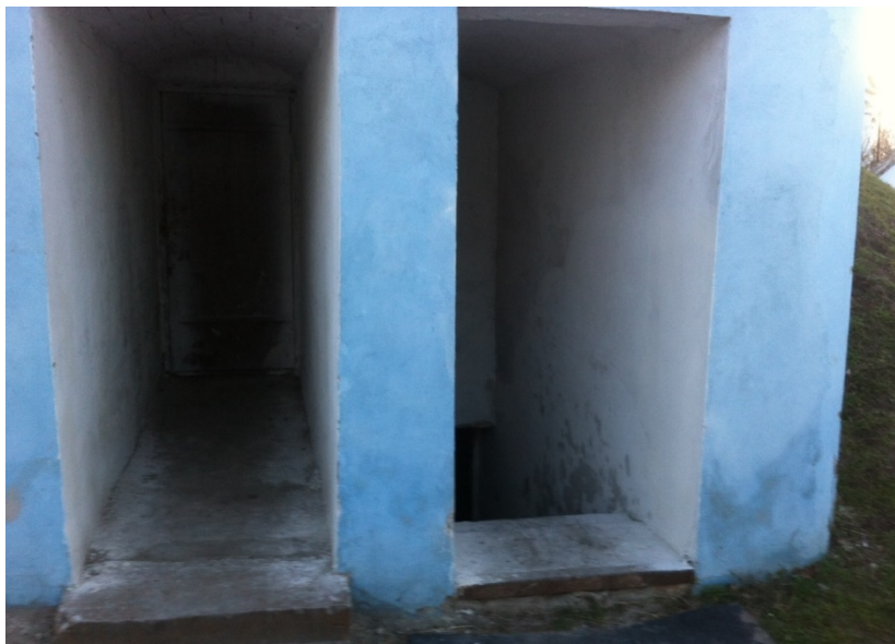
Рис. 4-а. Вхід до льоху на території Самарського Пустино-Миколаївського чоловічого монастиря (Дніпропетровська обл., Новомосковський р-н)