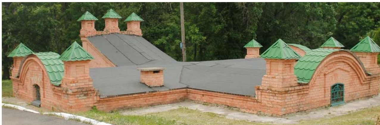
Рис.3. Льох Дендрологічного лісного центру «Веселі Боковеньки» (с. Веселі Боковеньки, Кіровоградська обл.)