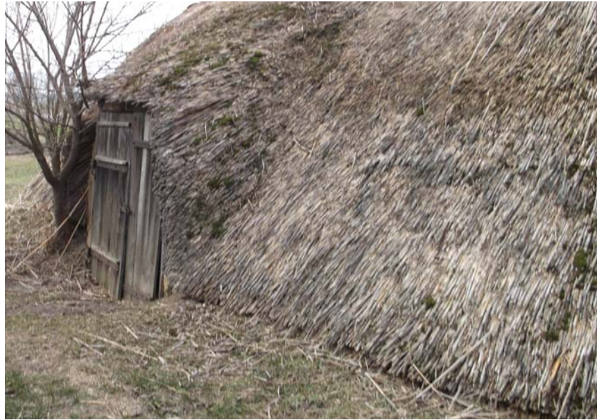
Рис. 7. Погреб на території сільської садиби (с. Гречене Петриківський р-н, Дніпропетровська обл.)

У пересічних українців погребі та льохи також користувалися і користуються до нині величезною популярністю. У виїзних експедиціях для вивчення народного житла Придніпровського регіону нам не трапилися садиби, які б не мали погребів чи льоху (рис. 6, 7).