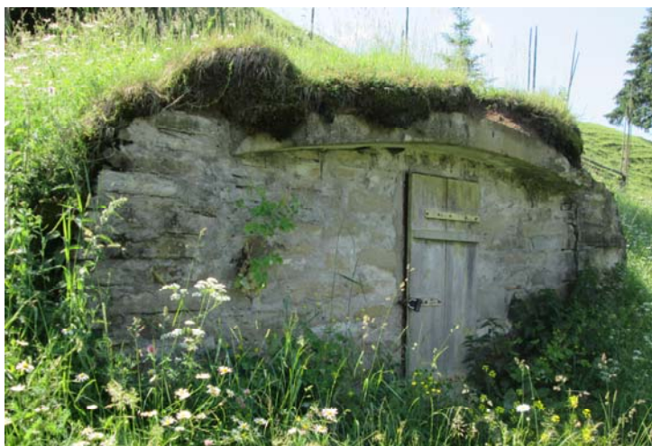
Рис. 5. Погріб на території Хати-музею кінофільму «Тіні забутих предків» (с. Верховина, Івано-Франківська обл.)