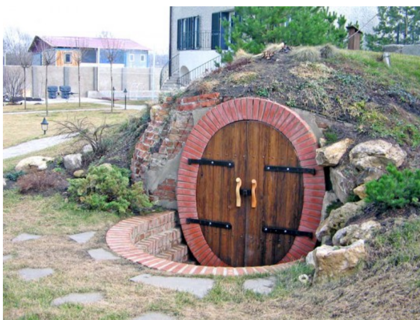
Рис. 12. Вхід до льоху на території сучасної садиби