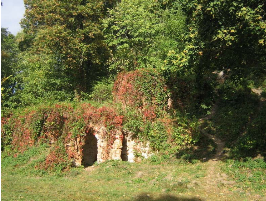
Рис. 1. Рештки льоху на території Національного історико-культурного заповідника «Качанівка», Чернігівська обл., Ічнянський р-н

грунту зі спеціально для них виготовленою двосхилою та трисхилою стрішкою. Часто погребі на Західній Україні розміщували за межами двору, а іноді навіть при дорозі. Інколи погребі будували на крутих схилах, використовуючи цокольне приміщення для зберігання продуктів [4]. Архип Данилюк, досліджуючи народне житло мешканців Західного Поділля, повідомляє, що погребі тут роблять неглибокі, оскільки земля має занадто багато вологи. [2, с. 84-93].