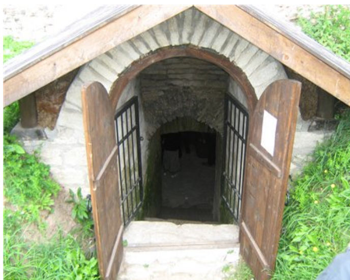
Рис. 11. Вхід до льоху на території сучасної садиби (с. Гречине, Петриківський р-н, Дніпропетровська обл.)