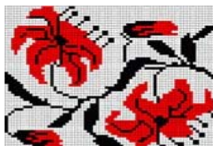
Рис. 3. Лілея

– виноград – символ таїнства створення нової сім'ї. Життєдайність винограду означає плодючість роду, його нескінченність. Це символ християнства, тому вишивається на родинних рушниках. Виноград – єдина з усіх рослин, яка найбільше вбирає сонячної енергії й зберігає її в ягодах довгий час, відтак має пряме відношення до нашого світила. Сад-виноград – це життєва нива, на якій чоловік – сіяч, а дружина зобов'язана рости і доглядати за родовідним деревом;