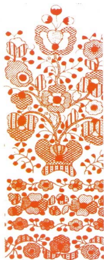
Рис. 1. Дерево життя

Над Деревом частину полотна залишали білою. Це символізувало Боже благословення, світле майбуття наступних поколінь.