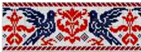
Рис. 6. Голуби

Іноді, замість птахів, над мотивом Дерева зустрічалося зображення сонця з променями.