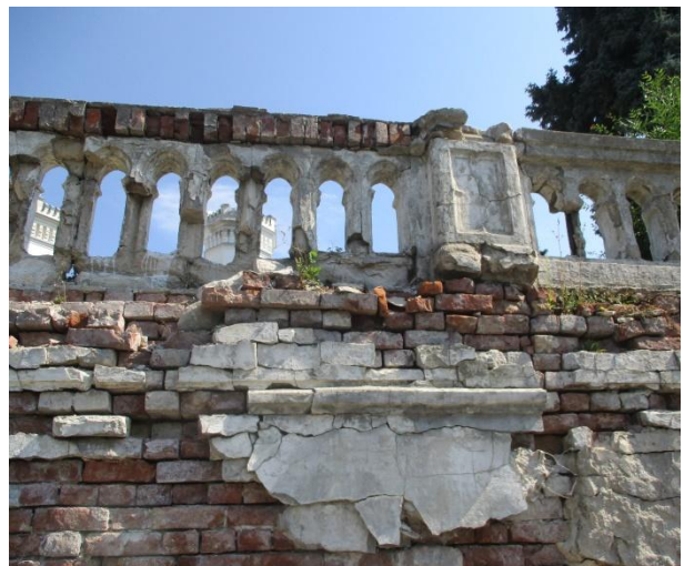
Рис. 5. Руїнування цегляної кладки підпірної стіни на глибину 250 мм / Fig. 5. The destruction of the brickwork of the retaining wall to a depth of 250 mm

Стіни і сходи тераси останніми роками зазнали значних пошкоджень і набули аварійного стану. Так, цегляна кладка підпірної стіни верхньої тераси розморожена і зруйнована на 30 % товщини стіни (на 250 мм), сходи з верхньої тераси також зруйновані (рис. 5).