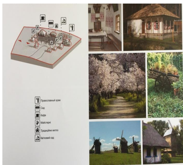
Рис. 10. Схема розташування функціональної зони «Український хутір» / Fig. 10. Scheme of the location of the functional zone "Ukrainian Farm"

Сценарій відвідування побудований виходячи із завдання максимально повно розкрити особливості і самобутній характер різних країн, при цьому зберігши однаково шанобливе ставлення до будь-якого народу, будь-якої релігії і культури.