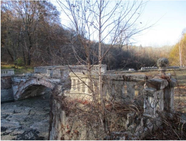
Рис. 6. Балюстрада нижньої тераси зруйнована / Fig. 6. The balustrade of the lower terrace is destroyed

мандриками на кронштейнах пояса стрілкової аркатури під увінчувальними карнизами, декоративні башти із зубцями (рис. 7).