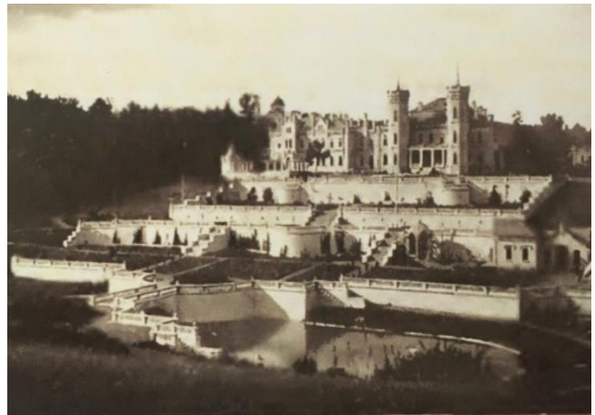
Рис 2. Загальний вигляд палацу і терас на початку XX століття / Fig. 2. General view of the Palace and terraces in the early XX century

Ансамбль садиби, яким він постає нині, набув своїх закінчених форм із 1894 по 1917 рік, коли садиба перейшла у володіння барона Леопольда Кеніга. У створенні архітектурного ансамблю брали участь інженер К. С. Шольц і німецький архітектор Якобі. У той час були перебудовані палац, тераси, манеж, стайні, гараж, електростанція, приміщення для робітників, каретні сараї, будинок управляючого замком. Над подальшим удосконаленням парку працював ландшафтний дизайнер Георг Куфальдт (рис. 2).