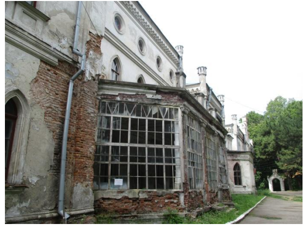
Рис. 8. Веранда палацу знаходиться в аварійному стані / Fig. 8. The veranda of the palace is in a state of emergency

розроблено рекомендації та креслення до виконання першочергових протиаварійних робіт [1; 2; 7].