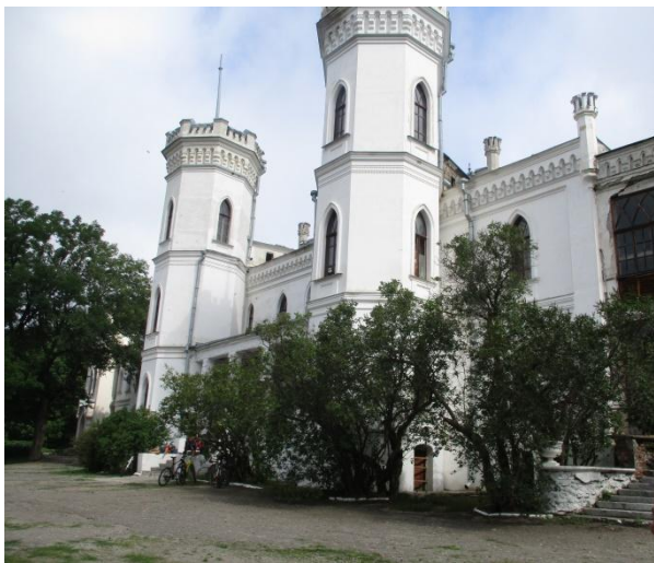
Рис. 7. Фасад палацу / Fig. 7. Facade of the palace

Також у декорванні фасадів застосовані прийоми та елементи, не характерні для готики: міжповерховий профільований карниз, лопатки, гладкий цоколь, прямокутні фільонки у підвіконнях. В оздобленні інтер'єрів палацу використано дерев'яні панелі, різьблені деталі, вітражі, тематичний і орнаментальний розпис.