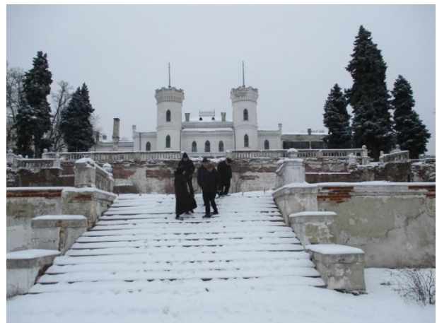
Рис 3. Сходи терас і палац / Fig. 3. Stairs of the Terraces and the Palace

У своєму проєкті Куфальдт розмістив ландшафтні групи та масиви зелених насаджень таким чином, що вони організовували три головні краєвиди – «променади» (круглий у плані бельведер на дні балки). З неї розкривається панорама