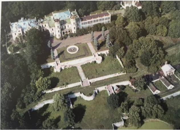
Рис. 1. Загальний вигляд палацово-паркового ансамблю «Садиба» в смт Шарівка / Fig 1. A general view of the palace and park ensemble "Sadyba" in the settlement Sharivka

Ансамбль «Садиба» розташований в смт Шарівка Богодухівського району Харківської області (рис. 1).