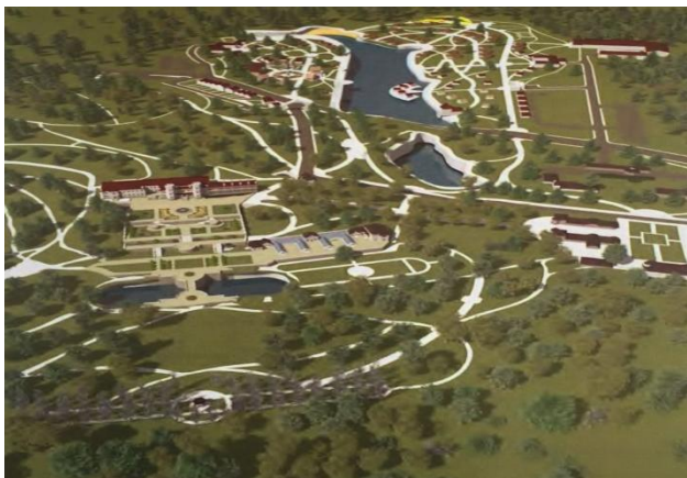
Рис. 9. Концепція етнопарку і туристичного екокомплексу / Fig. 9. The concept of the ethnopark and tourist ecocompartment

сезонний відпочинок), за соціальним вибором (для різних вікових груп населення), за різноманітністю туристичної діяльності (оздоровчий туризм, науково-пізнавальний туризм, еко- і етнотуризм) (рис. 9).