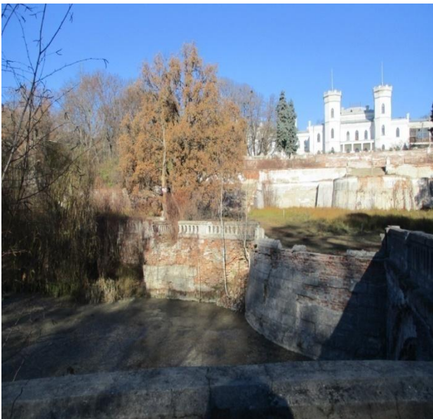
Рис 4. Став і галявина на дні балки садиби / Fig. 4. Became a lawn on the bottom of the gates of the estate

Із західної частини променаду розкривався панорамний краєвид, який складається з двох основних сюжетів: великий став у тальвезі балки та велика галявина, що підіймалася з дна балки по північному схилу та завершувалася павільйоном фазанника (рис. 4).