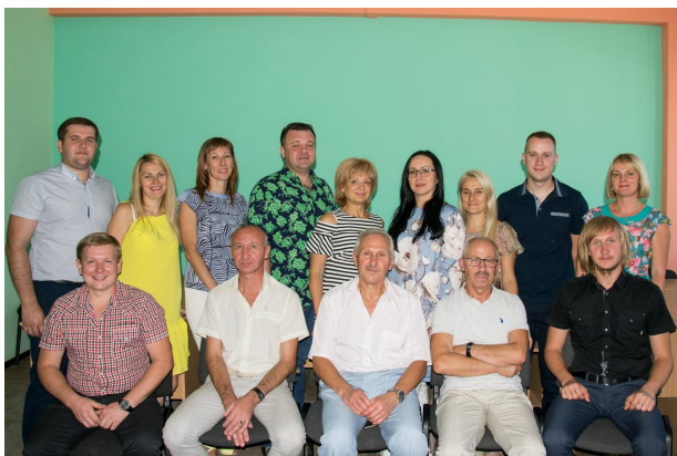
2020 рік. Зліва направо, зверху вниз:

охоплюють проблематику сталого розвитку, життєвого циклу будівельних конструкцій, екологічної архітектури та зеленого будівництва, енергоефективності, раціонального проектування будівельних конструкцій, будівель і споруд.