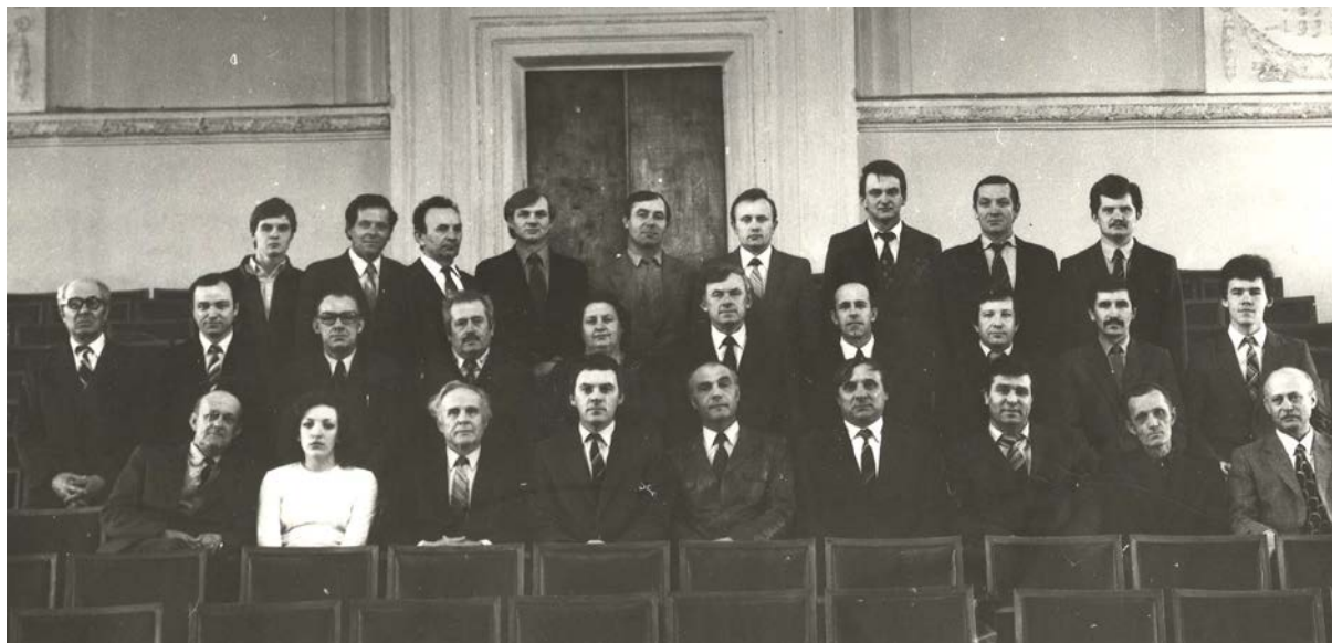
Фото 1. Кафедра “Будівельні і дорожні машини”, ДНУ, 1985 р.

а також зал обчислювальних машин із розробками програм на дослідження і розрахунків будівельних машин.