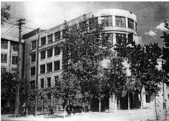
Рис. 9. Корпус Інженерно-будівельного інституту у 1930-ті рр.

З будівельним інститутом також пов'язане ім'я видатного вченого у галузі механіки, академіка АН УРСР, лауреата Державної премії СРСР Гурія Миколайовича Савіна (1907-1975). Із 1932 року він викладав на кафедрі будівельної механіки Дніпропетровського будівельного інституту, де й почав свою плідну наукову діяльність, яка отримала численні нагороди, у тому числі премію імені О. М. Динника АН УРСР (рис. 10).