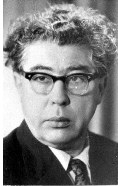
Рис. 10. Савін Г. М.

З будівельним інститутом також пов'язане ім'я видатного вченого у галузі механіки, академіка АН УРСР, лауреата Державної премії СРСР Гурія Миколайовича Савіна (1907-1975). Із 1932 року він викладав на кафедрі будівельної механіки Дніпропетровського будівельного інституту, де й почав свою плідну наукову діяльність, яка отримала численні нагороди, у тому числі премію імені О. М. Динника АН УРСР (рис. 10).