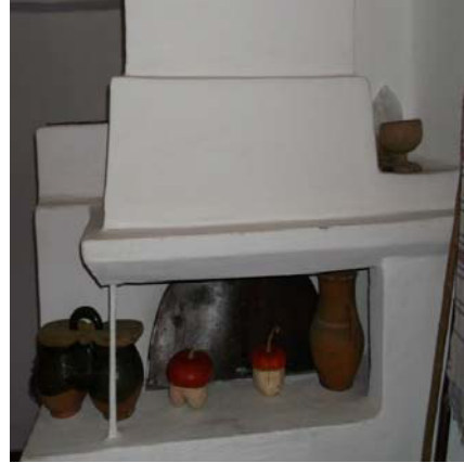
Рис. 1. Вариста піч, у якій готували в глиняному посуді

пошкоджена. Горщик із надщербленими вінцями, без вінець чи з тріщиною називали гирявим (гирун, горюнчик) [8].