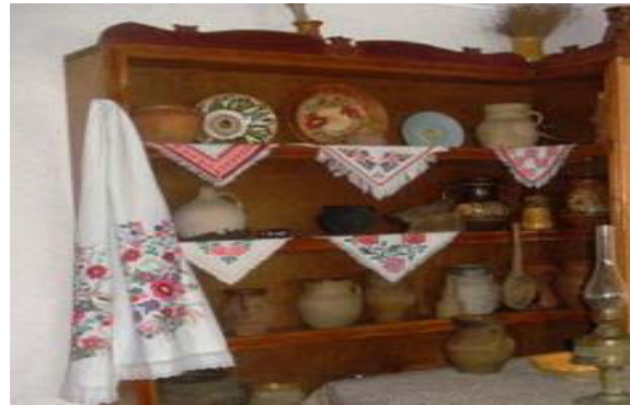
Рис. 2. Мисник із посудом та рушником для його витирання

В українській хаті крім печі (рис. 1), що, власне, завжди була осередком родинного побуту, в якій і готували їжу у глиняному посуді, на побілених стінах хати кольоровою плямою виділявся мисник із гончарним посудом, оздобленим вишитими рушником чи рушником для витирання посуду (стирач) (рис. 2).