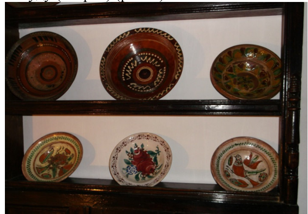
Рис. 3. Мисник-полиця

В українській хаті крім печі (рис. 1), що, власне, завжди була осередком родинного побуту, в якій і готували їжу у глиняному посуді, на побілених стінах хати кольоровою плямою виділявся мисник із гончарним посудом, оздобленим вишитими рушником чи рушником для витирання посуду (стирач) (рис. 2).